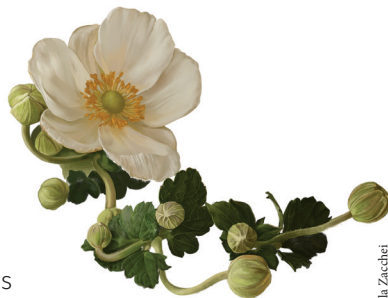
Antémoma japonesa - © Manuela Zacchei

Junto con la colaboración del área de Campus Cultural de la UC y la Escuela de Arte Nº1 de Cantabria, la UCC+i ha decidido traer esta exposición en la que no solo podréis ver los dibujos de Ilustraciencia, sino también las obras seleccionadas por parte de la Escuela de Arte Nº1.