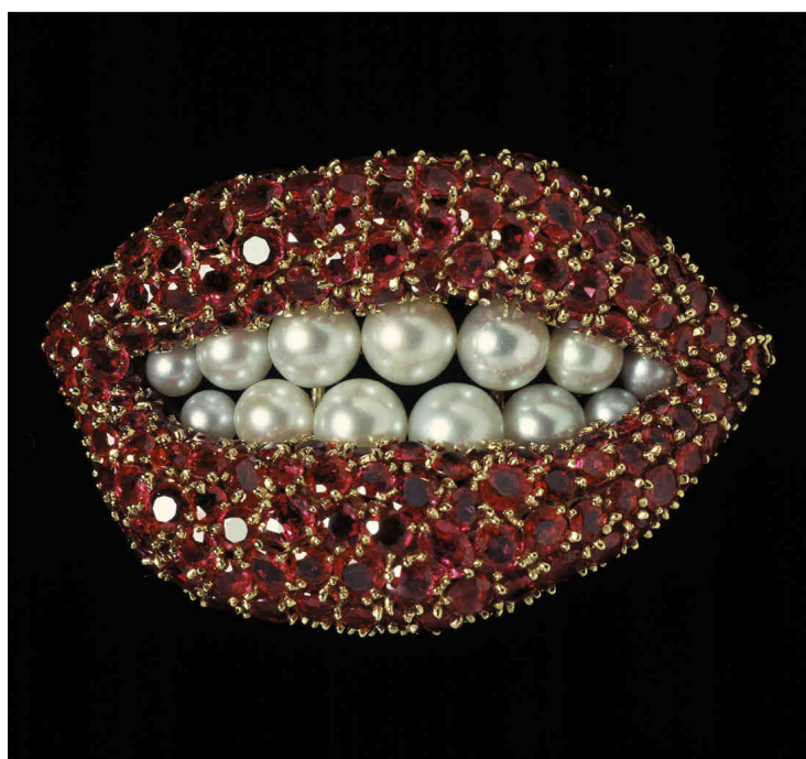
IMAGEN 3 Broche Rubi Lips de Salvador Dalí