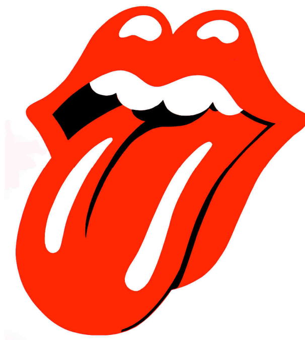
IMAGEN 2 Logotipo grupo Rolling Stones